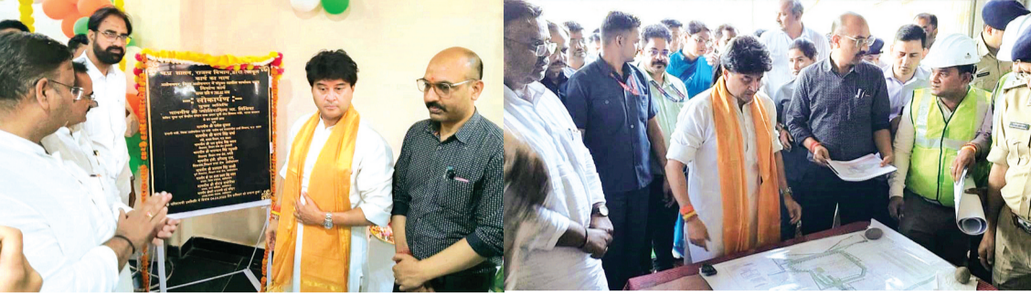
हरिभूमि न्यूज अशोकनगर

केंद्रीय संचार एवं पूर्वोत्तर क्षेत्र विकास मंत्री एवं क्षेत्रीय सांसद ज्योतिरादित्य सिंधिया द्वारा शनिवार को जिला मुख्यालय अशोकनगर स्थित 795.82 लाख रूपये से बने नवनिर्मित संयुक्त तहसील कार्यालय भवन अशोकनगर का लोकार्पण कर आमजन के लिए समर्पित किया। संयुक्त तहसील भवन के बन जाने से आमजन के राजस्व कार्यों में गति आयेगी। साथ ही कार्यालय में बेहतर सुविधाएं आमजन को मिल सकेंगी। अभी तक यह भवन पुराने तहसील कार्यालय में चल रहा था।