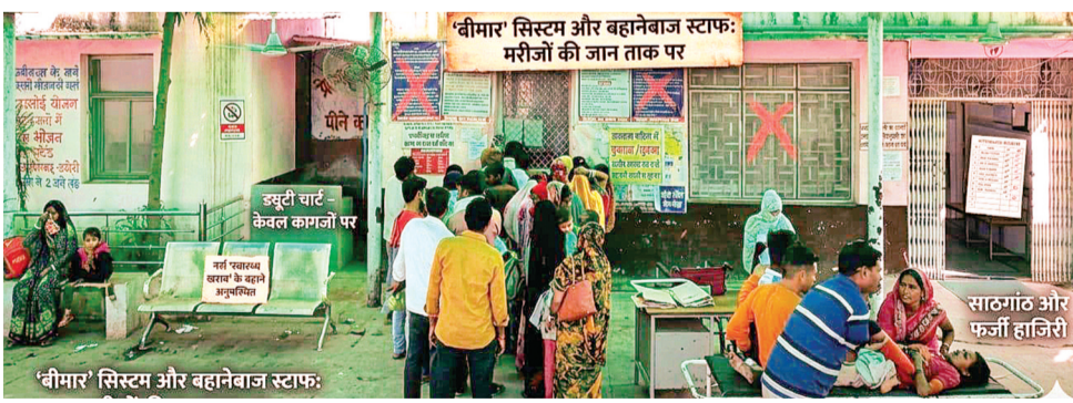
हरिभूमि न्यूज अशोकनगर

वीआईपी कल्चर तो बीमारी का बहाना, इयूटी से किनारा अस्पताल प्रबंधन द्वारा नियमानुसार इयूटी चार्ट तैयार किया जाता है, जिसमें दिन और रात की शिफ्ट तय होती है। नियम कहता है कि यदि कोई कर्मचारी दिन में तैनात है, तो उसकी रात की इयूटी नहीं होगी। लेकिन चंदेरी सिविल अस्पताल में इन नियमों को ताक पर रख दिया गया है। कर्मचारी अपनी सातगांठ और सुविधा के अनुसार शिफ्ट बदल लेते हैं, जिससे पूरी स्वास्थ्य व्यवस्था चरमरा गई है।