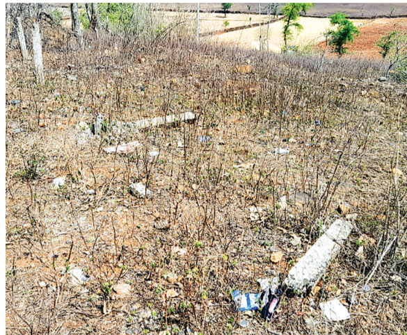
फेंसिंग को असामाजिक तत्वों द्वारा टूटा है लेकिन विभाग के अधिकारी क्षतिग्रस्त करते हुए तारों को चुराया जा रहा है इस तरह ध्यान ही नहीं दे रहे हैं।

जिले में वनों के संरक्षण और बचाव का दावा करने वाले वन विभाग के अधिकारियों की नाक के नीचे ही जंगलों की सुरक्षा को ठेगा दिखाया जा रहा है। मुख्यालय पर बाईपास स्थित नवनिर्मित रेंजर कार्यालय के सामने वन विभाग की भूमि स्थित है। इसी भूमि पर विभाग की तार फेंसिंग असे से टूटी पड़ी है पर जिम्मेदारों द्वारा तनिक भी ध्यान नहीं दिया जा रहा है।