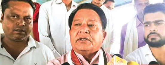
हरिभूमि न्यूज अशोकनगर

जिला किसान कांग्रेस कमेटी अशोकनगर द्वारा शनिवार को पुरानी गल्ला मंडी, अशोकनगर में आयोजित पत्रकार वार्ता में किसानों की ज्वलंत समस्याओं को लेकर सरकार की नीतियों पर कड़ा विरोध दर्ज कराया गया। इस दौरान वक्ताओं ने स्पष्ट कहा कि वर्तमान सरकार किसानों के मुद्दों पर पूरी तरह असेवेदनशील है। लगातार गलत नीतियों और प्रशासनिक अव्यवस्था के कारण अन्नदाता आर्थिक संकट में फंसा हुआ है, लेकिन सरकार केवल दिखावटी